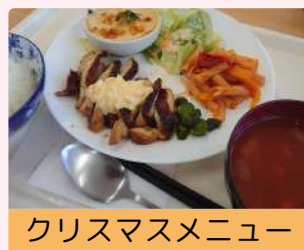
クリスマスメニュー