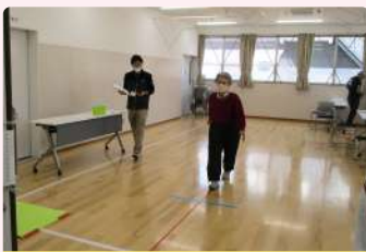
④ 5メートル歩行テスト